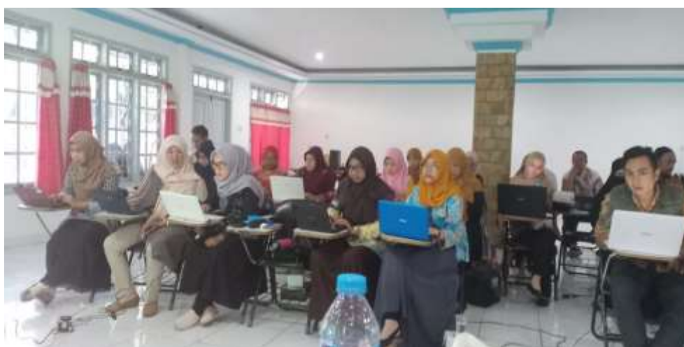
Gambar 4. Proses Praktik Pemanfaatan OJS

Pada proses demonstrasi register dan submisi naskah artikel jurnal, semua peserta berhasil melaluinya dengan tanpa kendala.