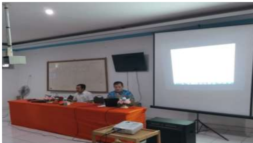
Gambar 2. Proses Penyampaian Materi oleh Narasumber

Dalam sesi ini, Tim pengelola Jurnal Kesehatan dan para Dosen di Lingkungan STIKes Cirebon sebagai peserta juga diberikan arahan terkait sistem penangkal plagiarisme e-Journal. Para peserta diberikan pemahaman terlebih dahulu bahwa mengutip pernyataan tulisan orang lain tanpa mencantumkan citasi merupakan sebuah pelanggaran etika akademik yang mana akan sangat beresiko jika fenomena tersebut terjadi secara jangka panjang karena dapat berdampak terhadap pelabelan akademik yang negatif (Yandra, Zamzami, & Febriadi, 2018). Dalam hal ini, peserta dapat menggunakan sistem aplikasi plagiat seperti Checker X sebagai sebuah sarana mengetahui persentasi originalitas artikel jurnal berkala ilmiah.