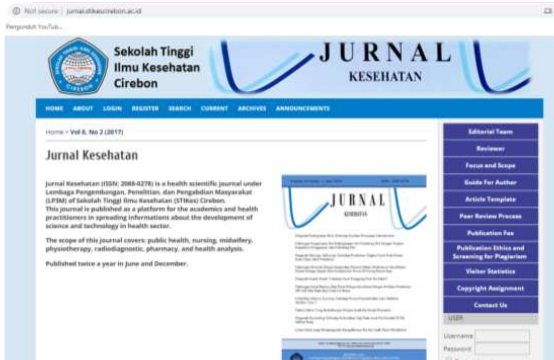
Gambar 6. Tampilan laman publikasi ilmiah Jurnal Kesehatan STIKes Cirebon

Di akhir kegiatan pendampingan, Tim pelaksana program pengabdian melakukan evaluasi bersama Tim pengelola Jurnal Kesehatan STIKes Cirebon mengenai langkah-langkah apa saja yang perlu dipersiapkan dan dilakukan agar dapat menghasilkan Jurnal elektronik/online sebagai strategi menuju jurnal yang berbasis OJS dan berakreditasi.