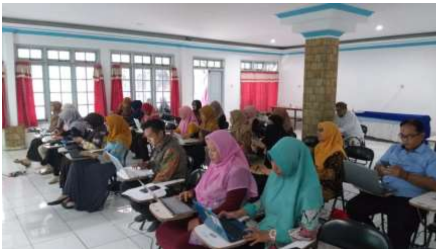
Gambar 3. Proses Penyampaian Fitur dalam OJS

Setelah itu, kegiatan workshop berlanjut dengan demonstrasi pemanfaatan OJS. Narasumber memulai dengan menyampaikan cara pembuatan akun penulis melalui fitur register pada OJS sebelum dapat menjadi author pada suatu platform publikasi jurnal berkala ilmiah. Narasumber melakukan demonstrasi terkait cara melakukan registrasi bersamaan dengan dijelaskannya kolom per kolom yang perlu dilengkapi pada sistem OJS. Dalam hal ini, narasumber juga mengingatkan agar para peserta dapat melakukan ceklis pada beberapa kolom terakhir yang menegaskan tujuan dilakukannya register apakah hanya sebagai Reader , Author , atau juga sebagai Reviewer . Setelah proses demonstrasi register berjalan dengan lancar, narasumber kemudian memberikan arahan untuk proses submisi naskah pada OJS. Proses submisi naskah meliputi lima langkah, yaitu;