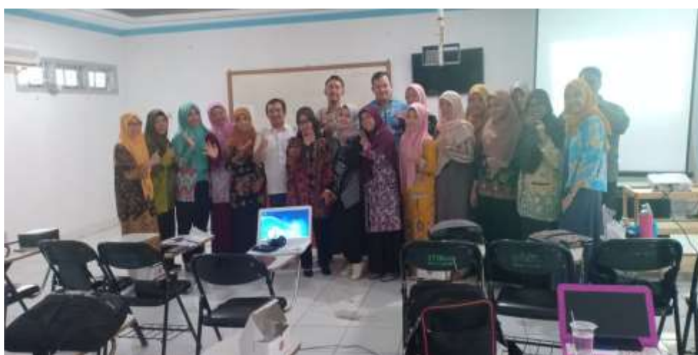
Gambar 5. Foto Bersama Narasumber dengan Peserta se usai acara Workshop

Setelah kedua sesi workshop berlangsung, narasumber menyampaikan pentingnya STIKes Cirebon belajar dari perguruan tinggi lain terutama perguruan tinggi yang berada pada satu wilayah Kota Cirebon. Dalam sesi ini, narasumber menyampaikan hasil perbandingan peringkat STIKes Cirebon dengan 10 peringkat perguruan tinggi Indonesia tertinggi dan beberapa perguruan