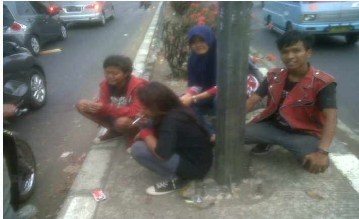
Gambar tempat tinggal anjal perempuan