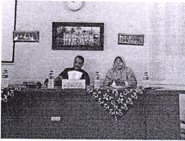
KUNJUNGAN 1 PENYERAHAN MHS PLP DI SMA 8