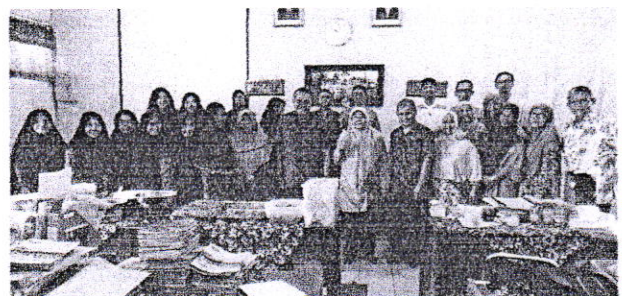
KUNJUNGAN 14 PERPISAHAN MHS PLP DI SMA 8