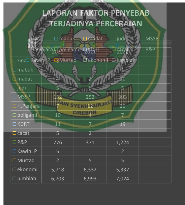
Gambar 2 : Penyebab Perceraian Dari Pengadilan Agama Sumber

Dan dapat kita lihat ada pula data penyebab terjadinya perceraian Berdasarkan data dari Pengadilan Agama Sumber dari tiap tahunnya adanya berbagai factor penyebab timbulnya perceraian yang menyebabkan terjadinya perceraian seperti zina, mabuk, madat, judi, menelantarkan pasangan, mendapat hukuman penjara, poligami, kekerasan dalam rumah tangga, cacat fisik, perselisihan dan pertikaian secara berangsur-angsur, kawin paksa, murtad, dan finansial. Adapun factor penyebab terjadinya perceraian dipengadilan agama sumber sebagai berikut :