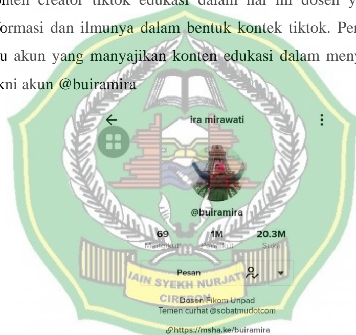
Gambar 2. Tampilan Akun Tiktok @buiramira

Penelitian ini berusaha untuk mengetahui bagaimana peran media sosial tiktok dalam memotivasi mahasiswa KPI dalam mengerjakan skripsi. Konten creator tiktok edukasi dalam hal ini dosen yang membagikan informasi dan ilmunya dalam bentuk kontek tiktok. Peneliti menemukan satu akun yang menyajikan konten edukasi dalam menyelesaikan skripsi yakni akun @buiramira