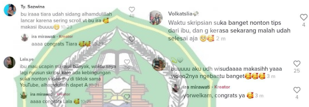
Gambar 3. Respon Positif dari Penonton Konten tiktok @buiramira

Peneliti pun melakukan observasi singkat pada akun tiktok @buiramira dan menemukan banyak sekali komentar yang mengungkapkan bahwa konten tiktok @buiramira telah membantu dalam proses pengerjaan skripsi. Contoh komentar :