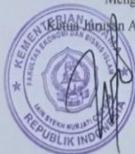
Nining Wahyuningsih, SE, MM