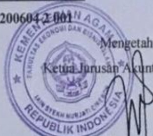
Ninng Wahuhingsih, SE, MM