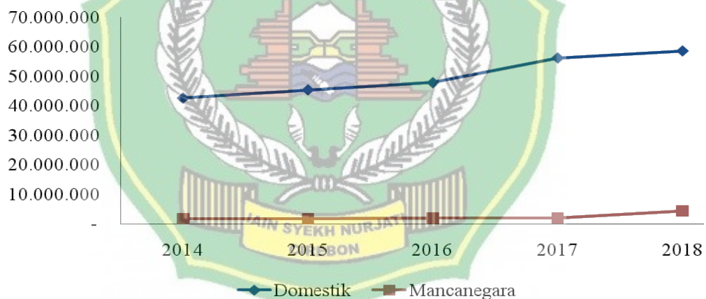
Gambar 1.2 Jumlah Kunjungan Wisatawan di Jawa Barat