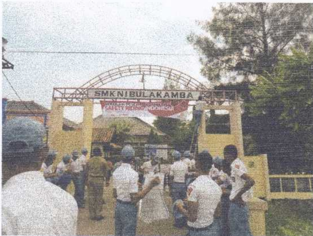
Foto Siswa kelas XI TITL