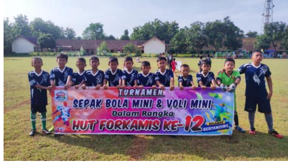
فرقة كرة القدم