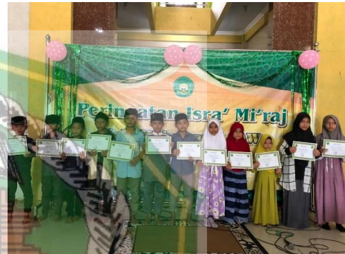
تذكرة إسرائع معراج