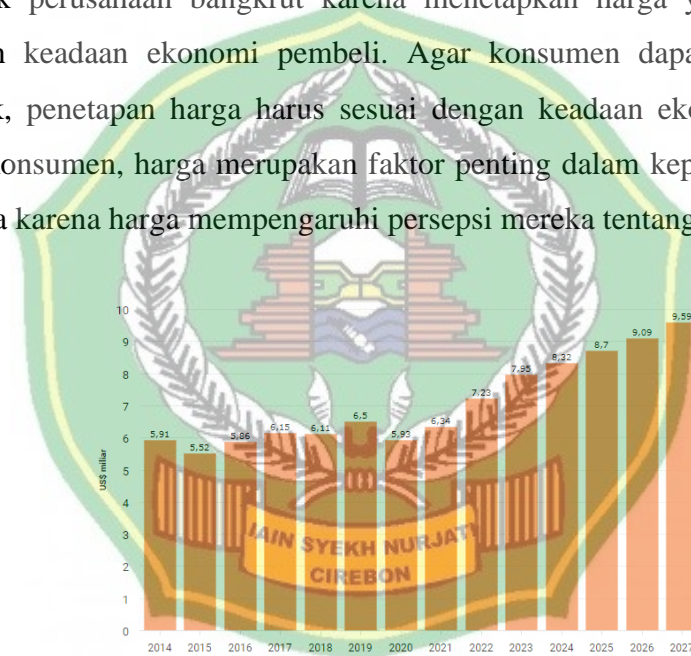
Gambar 1. 1

Harga merupakan faktor yang mempengaruhi kepuasan konsumen. Banyak perusahaan bangkrut karena menetapkan harga yang tidak sesuai dengan keadaan ekonomi pembeli. Agar konsumen dapat membeli suatu produk, penetapan harga harus sesuai dengan keadaan ekonomi konsumen. Bagi konsumen, harga merupakan faktor penting dalam keputusan pembelian mereka karena harga mempengaruhi persepsi mereka tentang produk tersebut.