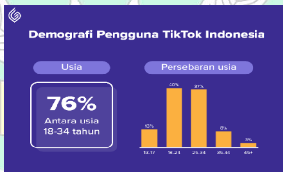
Gambar 1. 2

Salah-satu dari banyaknya media sosial yang masuk dalam kategori media baru yang sudah melakukan inovasi ialah aplikasi TikTok. Tiktok adalah aplikasi untuk membuat video kreatif yang dibuat pada September 2016 oleh perusahaan ByteDance dengan basis Tiongkok, Cina. Tiktok menerima penghargaan sebagai jajaran aplikasi terbaik di Google Play Store setelah peningkatan penggunaan pada tahun 2018. Menurut Adawiyah (2020), ada kira-kira lima puluh orang yang aktif menggunakan aplikasi di Indonesia. Tiktok kemudian mengembangkan konten dengan informasi tentang produk seperti unboxing dan ulasan. Hal ini menimbulkan rasa ketertarikan dan penasarannya dan menyebabkan fitur Toko di Tiktok, yang menghasilkan fenomena Racun Tiktok, yang sebagian besar penggunanya adalah generasi milenial, yang memicu perilaku konsumtif (Triyanti et al., 2022).