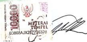
Qais Naufal Azmi