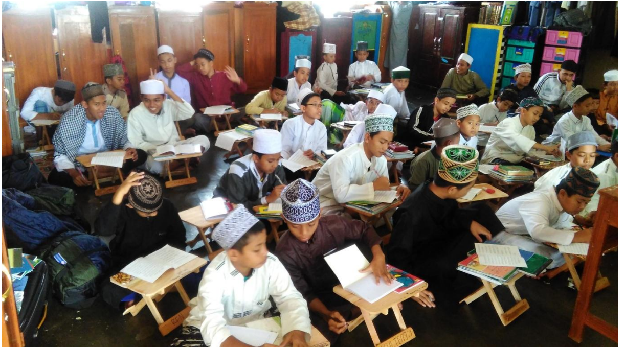
Dianatar kegiatan observasi dan wawancara