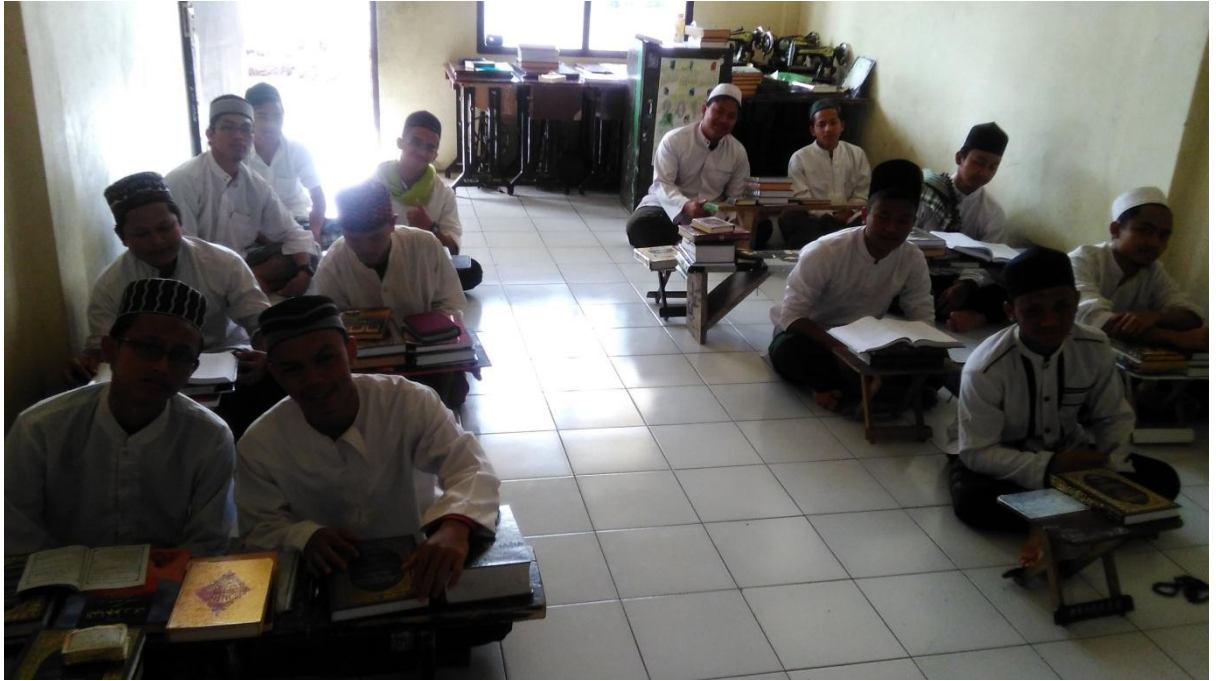
Kantor Yayasan dan Pondok