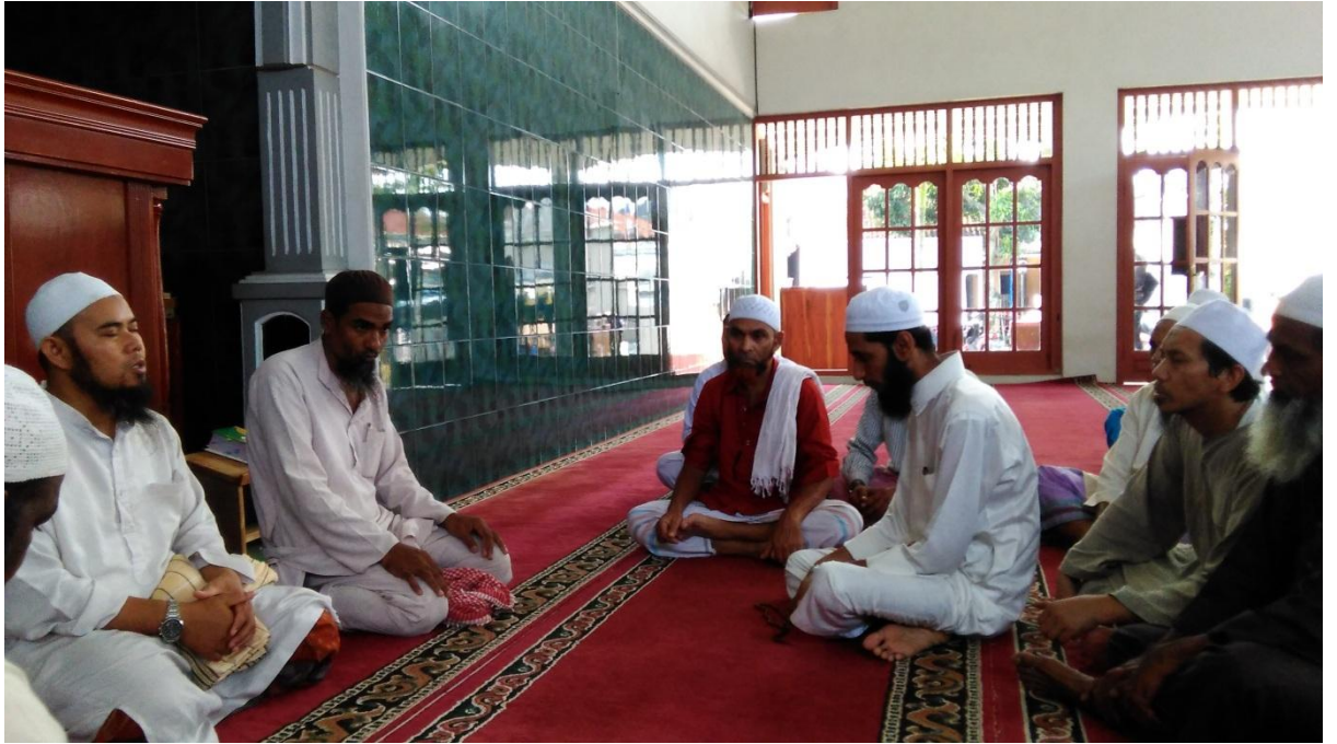
Menghadiri Ta'lim setelah shalat Ashar, Jamaah dari Pakistan