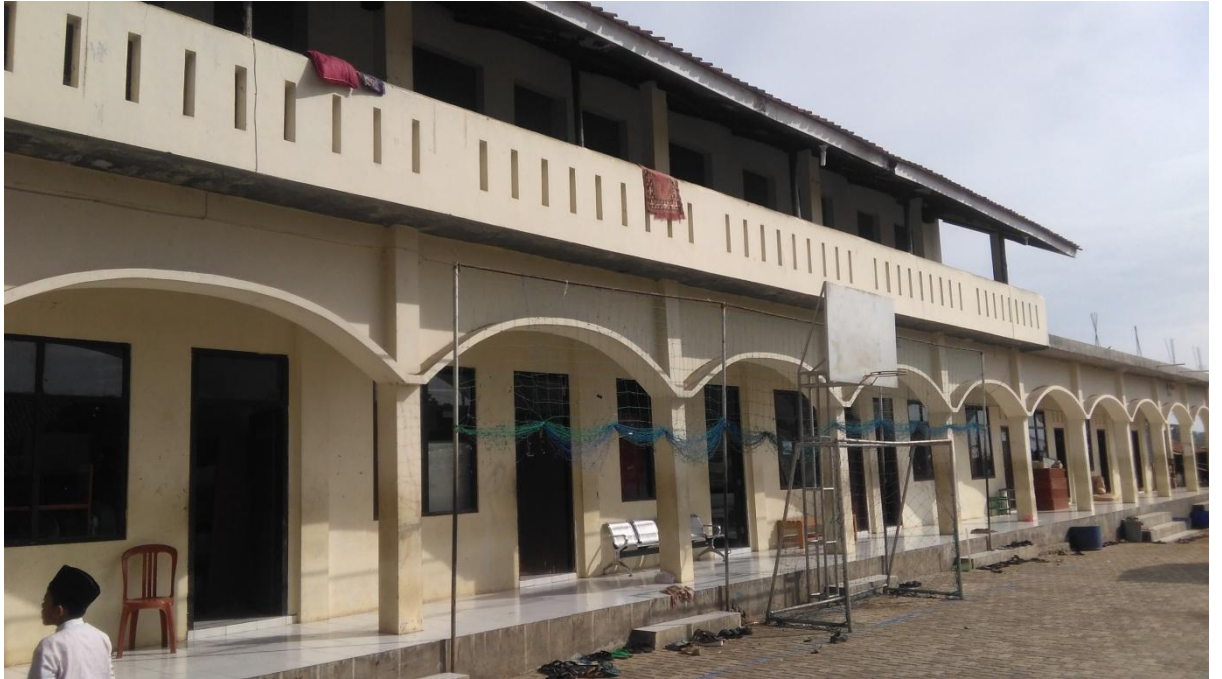
Bangunan Masjid di Dekat Pintu Masuk