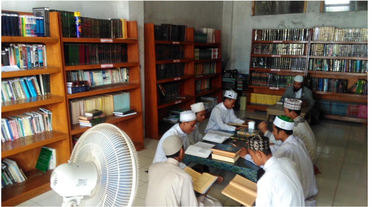
Kegiatan Tahfidz di Ruang kelas sekaligus tempat tidur