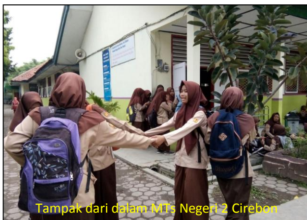
Tampak dari dalam MTs Negeri 2 Cirebon