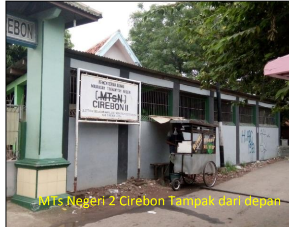
MTs Negeri 2 Cirebon Tampak dari depan