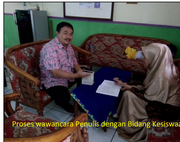
Proses wawancara Penulis dengan Bidang Kesiswaan