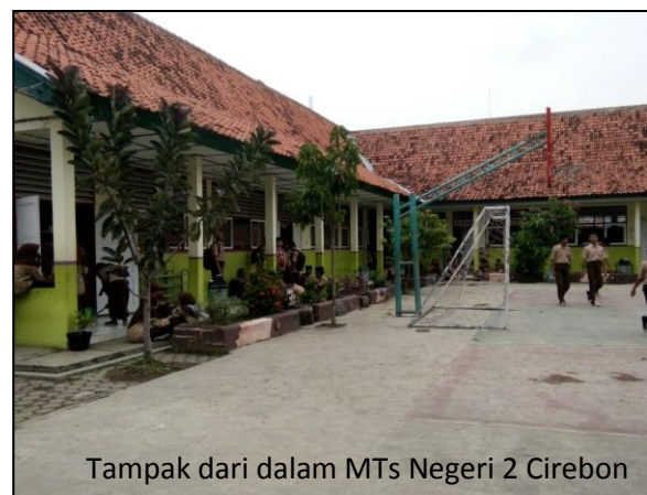
Tampak dari dalam MTs Negeri 2 Cirebon