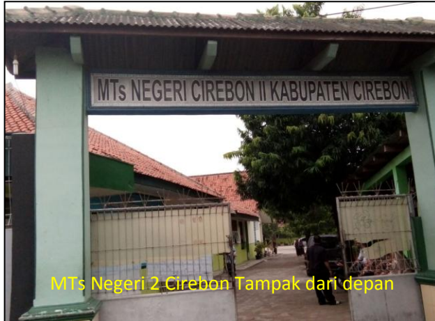
MTs Negeri 2 Cirebon Tampak dari depan