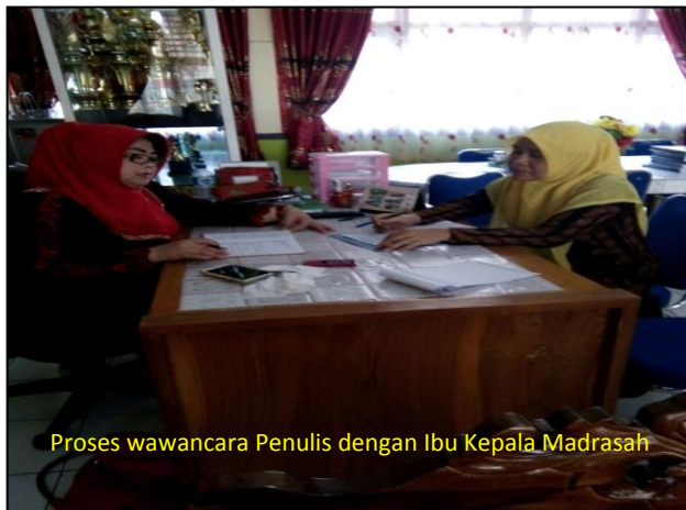
Proses wawancara Penulis dengan Ibu Kepala Madrasah