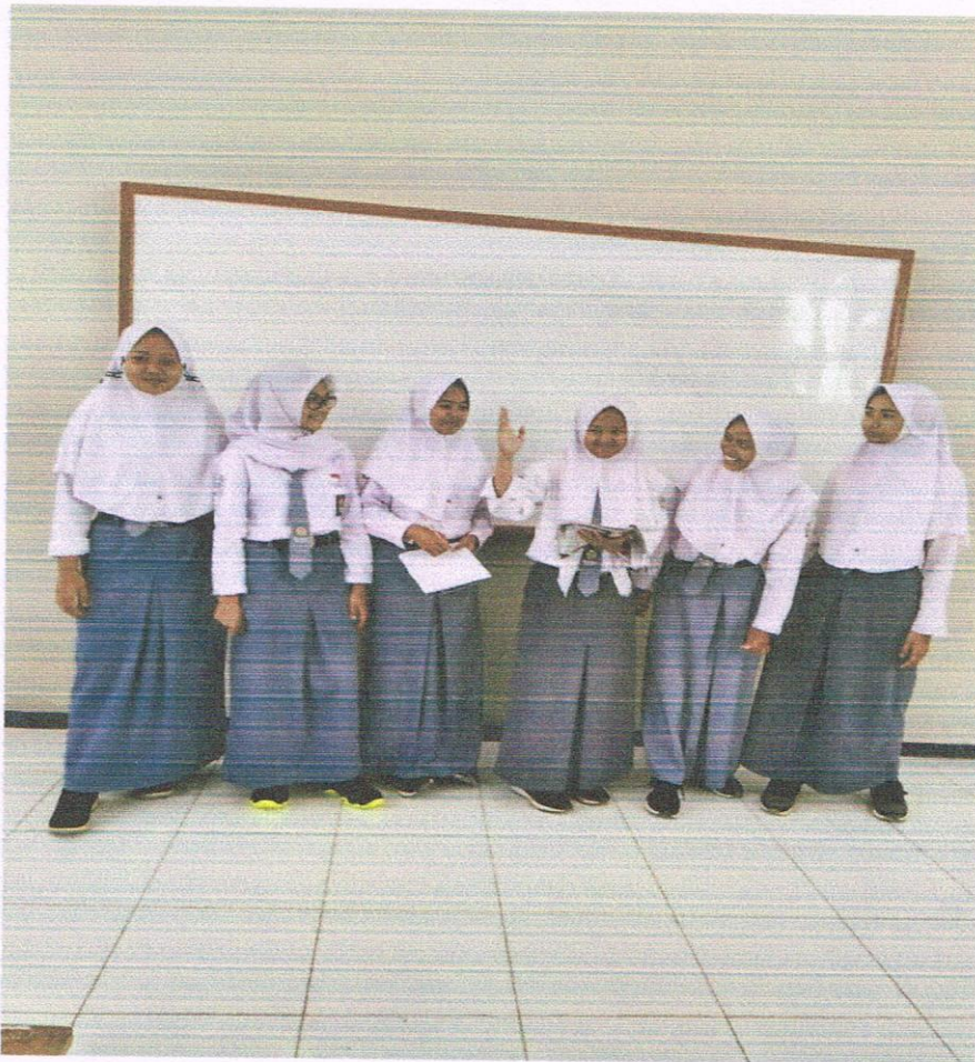
Siswa kelas X IPA mempresentasikan hasil karya mereka