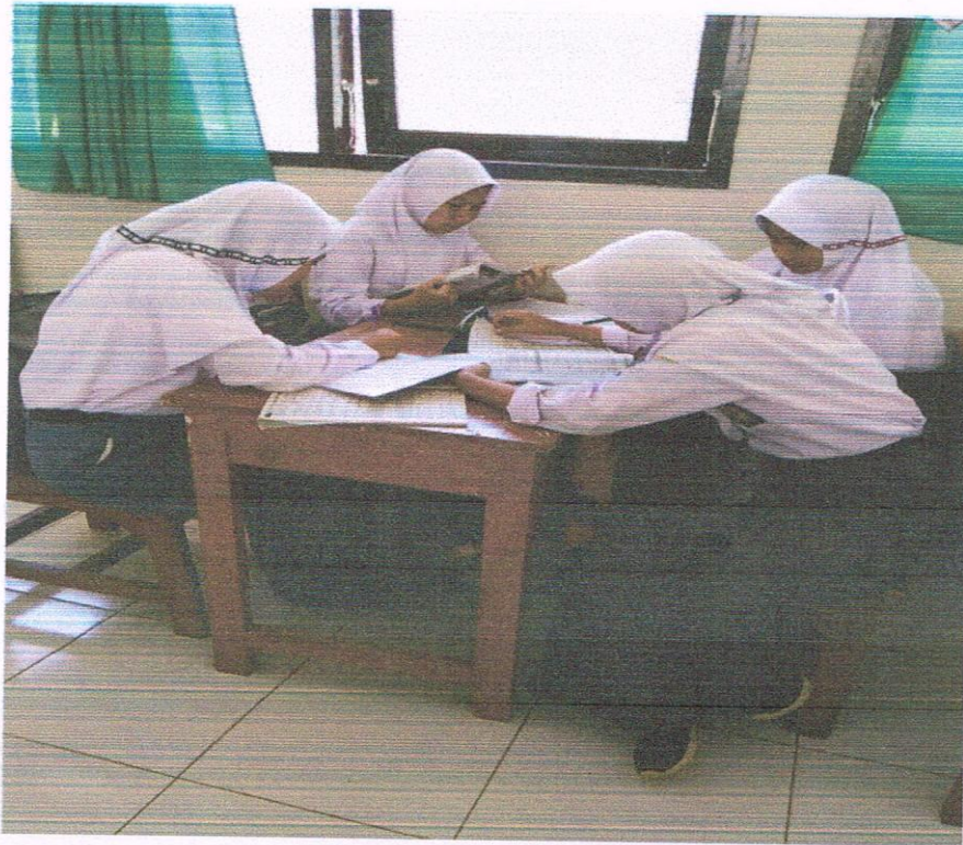
Kegiatan pembelajaran Siswa kelas X IPA dengan model PBL terlihat sangat aktif mencermati materi pembelajaran.