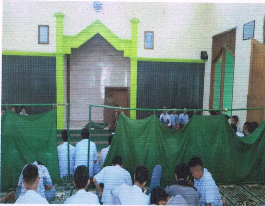
Shalat duhur berjamaah kelas X IPS