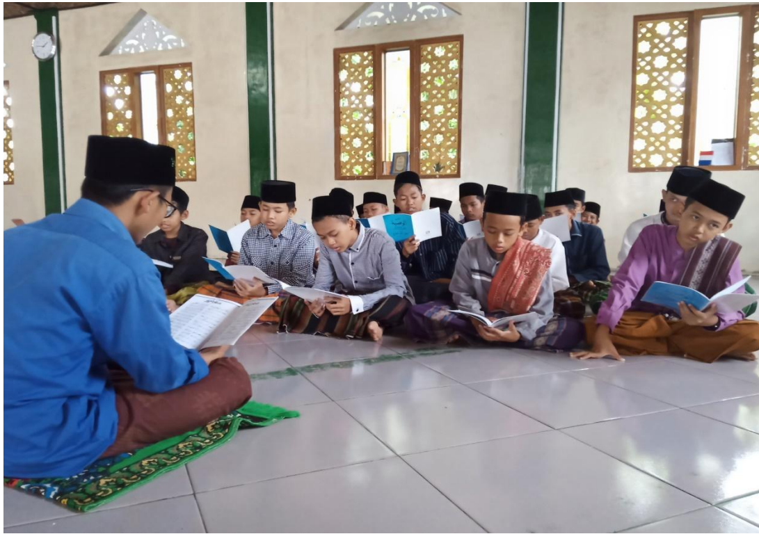
Pembelajaran kitab Al-Waṣ iyyat Fī Al-Akhlāq