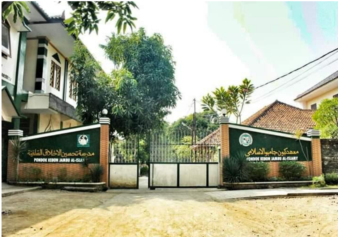
Gerbang Pondok Kebon Jambu Al-Islamy