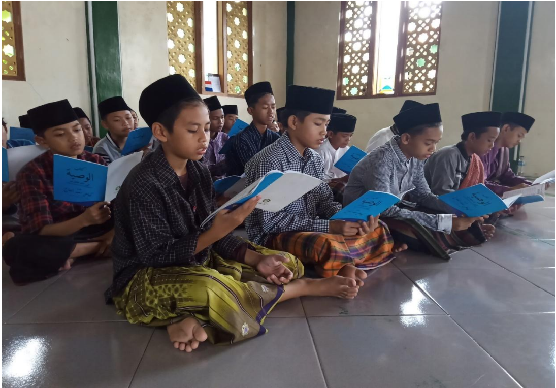
Pembelajaran kitab Al-Waṣ iyyat Fī Al-Akhlāq