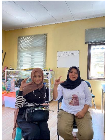
Wawancara dengan ibu Een selaku Masyarakat dan Pengelola Homestay