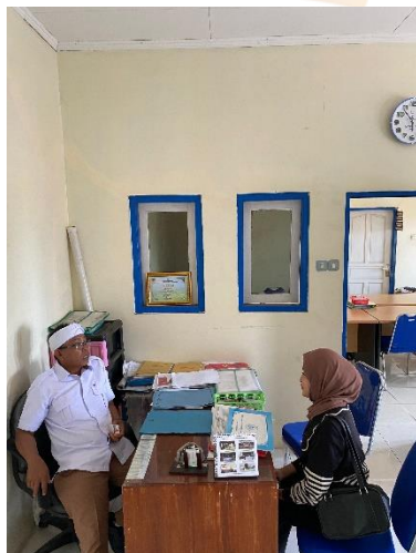
Wawancara dengan bapak Tirta selaku pihak Desa Wisata Cibuntu