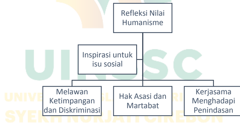
Gambar 2.1 Kerangka Berpikir

Kerangka ini kemudian menghubungkan pemikiran humanisme Pramoedya dengan relevansinya dalam menghadapi tantangan sosial modern. Ketimpangan sosial, diskriminasi, dan pelanggaran hak asasi manusia adalah isu-isu yang terus hadir di masyarakat dan dapat diatasi dengan mengimplementasikan nilai-nilai humanisme. Melalui kebebasan individu dan solidaritas sosial, gagasan Pramoedya memberikan inspirasi untuk menciptakan tatanan masyarakat yang lebih adil dan humanis, sesuai dengan nilai-nilai Pancasila dan realitas sosial Indonesia masa kini.