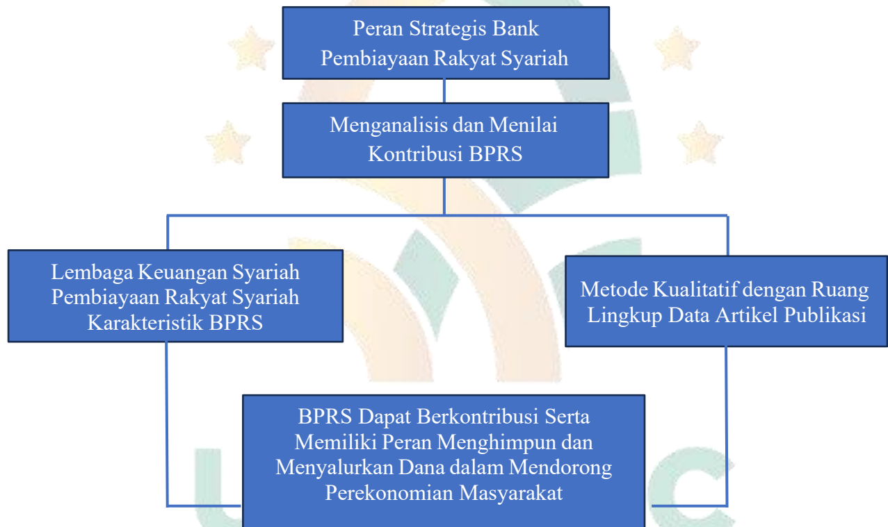
Gambar 1.1 Kerangka Penelitian

Penerapan etika bisnis dalam perbankan tidak hanya berkontribusi pada reputasi bank, tetapi juga pada stabilitas sistem keuangan secara keseluruhan. Oleh karena itu, penting bagi lembaga perbankan untuk mengintegrasikan prinsip-prinsip etika dalam setiap aspek operasional dan pengambilan keputusan mereka.