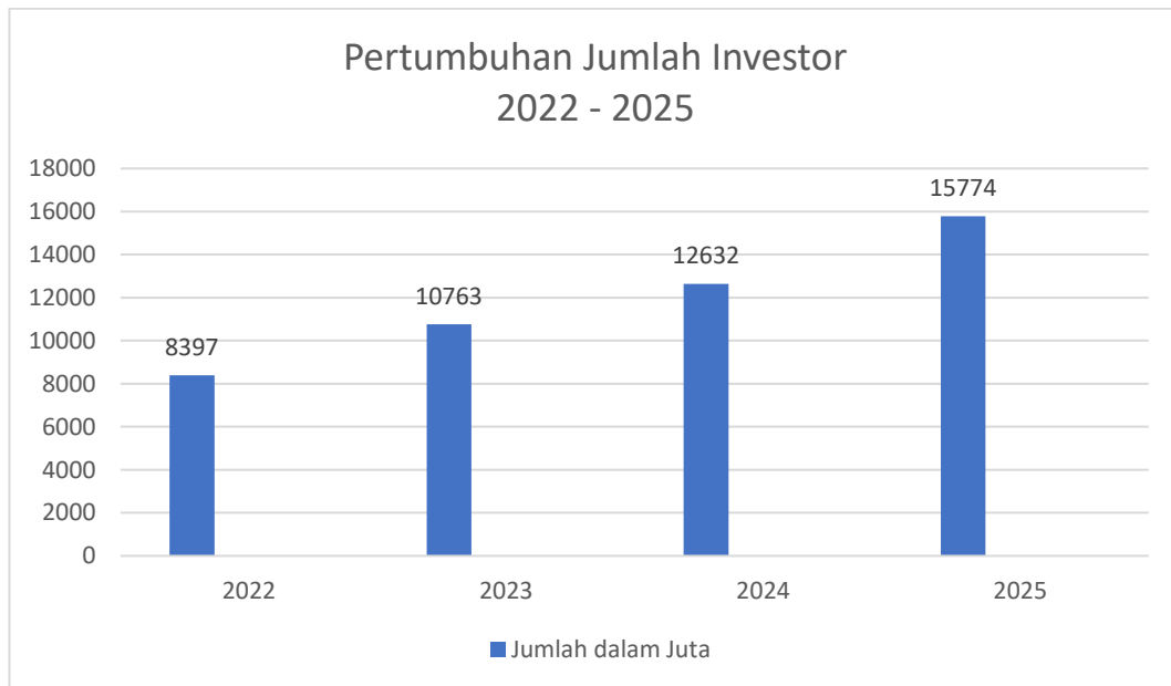
Gambar 1. 1 Jumlah Investor Tahun 2022-2025