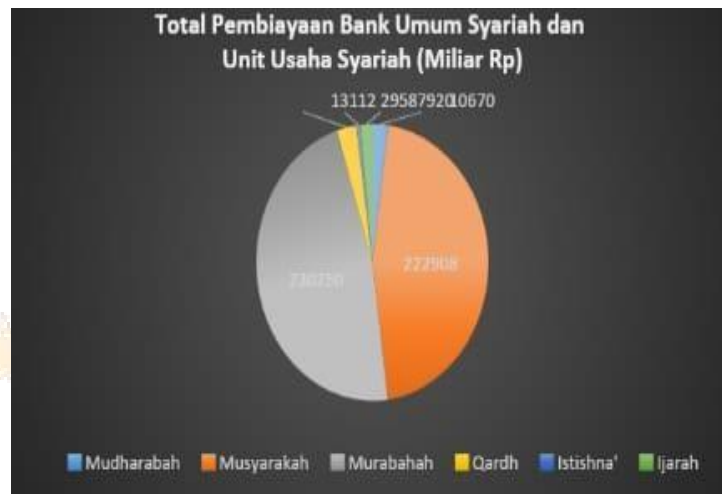
Gambar 1. 1 Total Pembiayaan Bank Umum Syariah dan Unit Usaha Syariah