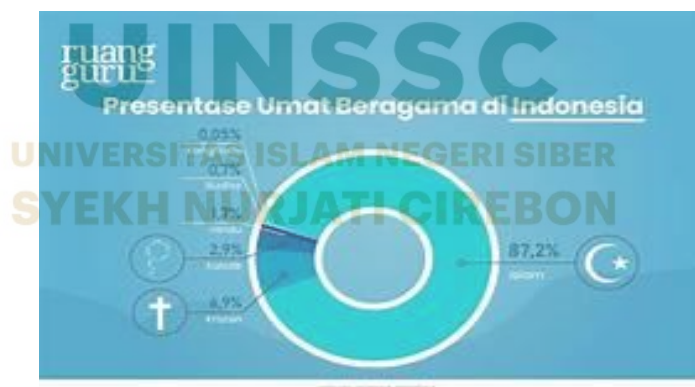
Gambar 1: Jumlah penganut agama islam di indonesia

Indonesia merupakan negara dengan mayoritas penduduk beragama Islam. Berdasarkan data demografi, jumlah penduduk Muslim di Indonesia mencapai 245,97 juta jiwa atau sekitar 87,02% dari total penduduk sebanyak 282,47 juta jiwa. Dalam memenuhi kebutuhan ekonomi dan permodalan, masyarakat Indonesia tidak terlepas dari peran lembaga keuangan, yang secara umum terbagi ke dalam dua jenis, yaitu lembaga keuangan konvensional dan lembaga keuangan syariah. Lembaga keuangan konvensional seperti bank dan koperasi menjalankan kegiatan usahanya dengan sistem bunga yang dalam perspektif Islam dikategorikan sebagai riba (Muhammad Kurniawan & Sy, 2021). Praktik riba secara tegas dilarang dalam Al-Qur'an sebagaimana tercantum dalam Q.S. Al-Baqarah ayat 275, yang menyatakan bahwa Allah menghalalkan jual beli dan mengharamkan riba. Sebagai alternatif, berkembang lembaga keuangan syariah seperti bank syariah dan Baitul Maal wa Tamwil (BMT) yang beroperasi berdasarkan prinsip-prinsip syariah Islam.