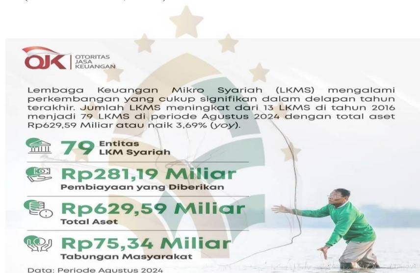
Gambar2: Data Perkembangan Lembaga Keuangan Mikro Syariah

Dalam konteks tersebut, pemasaran menjadi salah satu faktor strategis bagi lembaga keuangan syariah karena berpengaruh langsung terhadap perluasan pangsa pasar dan tingkat pemanfaatan layanan oleh masyarakat. Berdasarkan data Otoritas Jasa Keuangan (OJK), pangsa pasar lembaga keuangan syariah mengalami peningkatan dari 7,27% pada Agustus 2024 menjadi 7,44% pada September 2024. Peningkatan ini mencerminkan bahwa dalam beberapa tahun terakhir, industri keuangan syariah di Indonesia terus menunjukkan perkembangan yang positif (Awaludin et al., 2022).