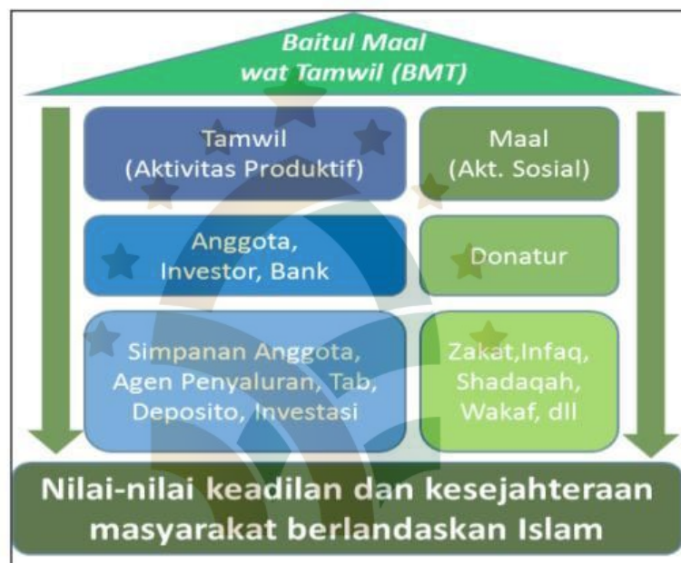
Gambar3: Gambaran umum Baitul Mal wa Tamwil (BMT)

disalurkan meningkat menjadi Rp281,19 miliar, sementara tabungan masyarakat yang berhasil dihimpun mencapai Rp75,34 miliar pada periode yang sama. Peningkatan tersebut menunjukkan bahwa LKMS, termasuk BPRS dan Baitul Maal wat Tamwil, memiliki potensi yang besar untuk terus berkembang serta memberikan kontribusi yang lebih luas bagi penguatan perekonomian mikro syariah di Indonesia (Albanjari, 2023).