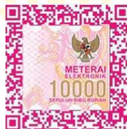
Fahmi Firdaus Hilmi