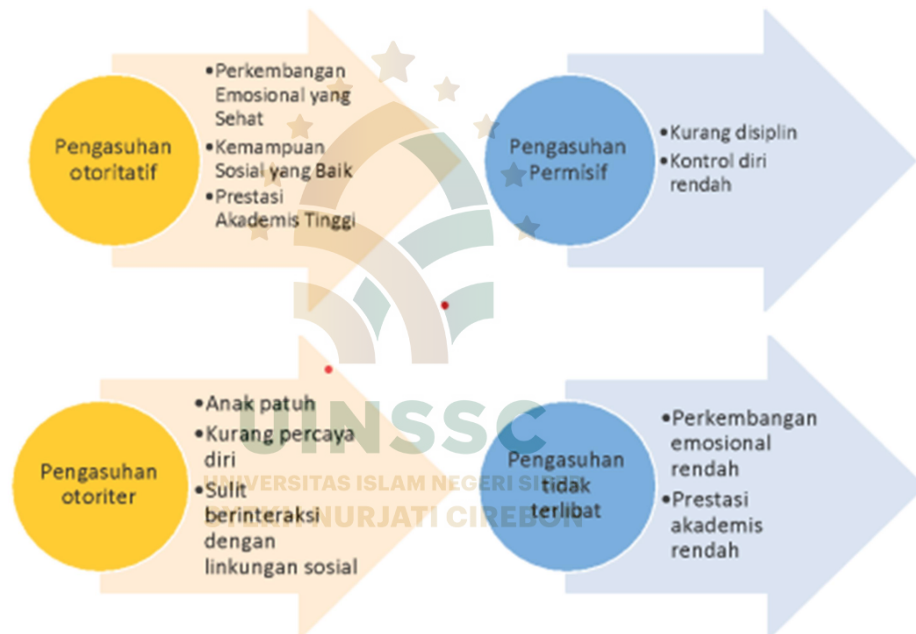
Tabel 1.1. Dampak Pola Asuh terhadap Anak

Bagan di atas selaras dengan publikasi tahunan Badan Pusat Statistik (BPS) yang menyatakan bahwa lebih dari seperempat penduduk Indonesia menikah pada rentang usia 16-18 tahun. Usia perkawinan tersebut sangat berdampak pada perkembangan kesejahteraan rakyat Indonesia antar waktu, terutama pada pola pengasuhan terhadap anak yang dilahirkan dari