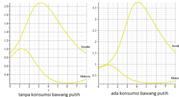
Gambar 2 Simulasi efek penggunaan bawang putih

Untuk melihat efek konsumsi bawang putih, perhatikan grafik di bawah ini :