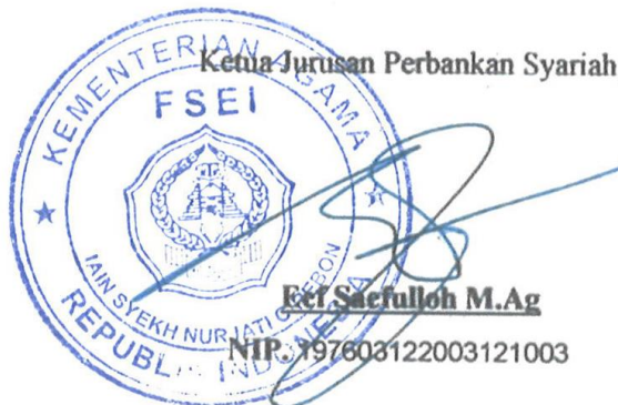
Eti Saefullah M.Ag