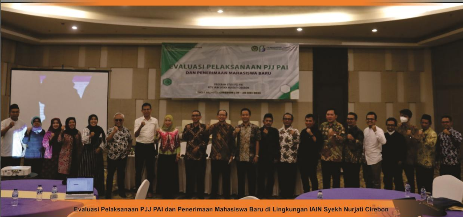
Evaluasi Pelaksanaan PJJ PAI dan Penerimaan Mahasiswa Baru di Lingkungan IAIN Syekh Nurjati Cirebon