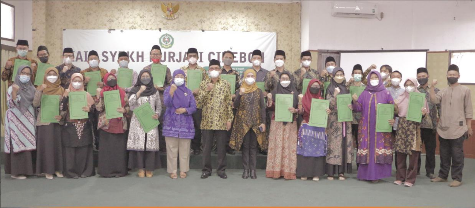
Tingkatkan Pelayanan Rektor melantik Tenaga Pendidik dan Kependidikan di lingkungan IAIN Syekh Nurjati Cirebon