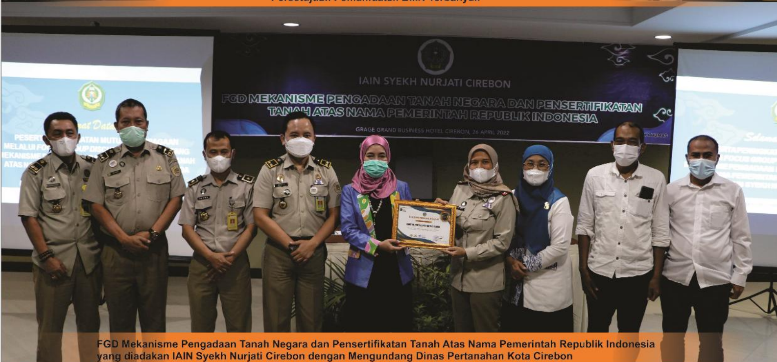
FGD Mekanisme Pengadaan Tanah Negara dan Pensertifikatan Tanah Atas Nama Pemerintah Republik Indonesia yang diadakan IAIN Syekh Nurjati Cirebon dengan Mengundang Dinas Pertanahan Kota Cirebon