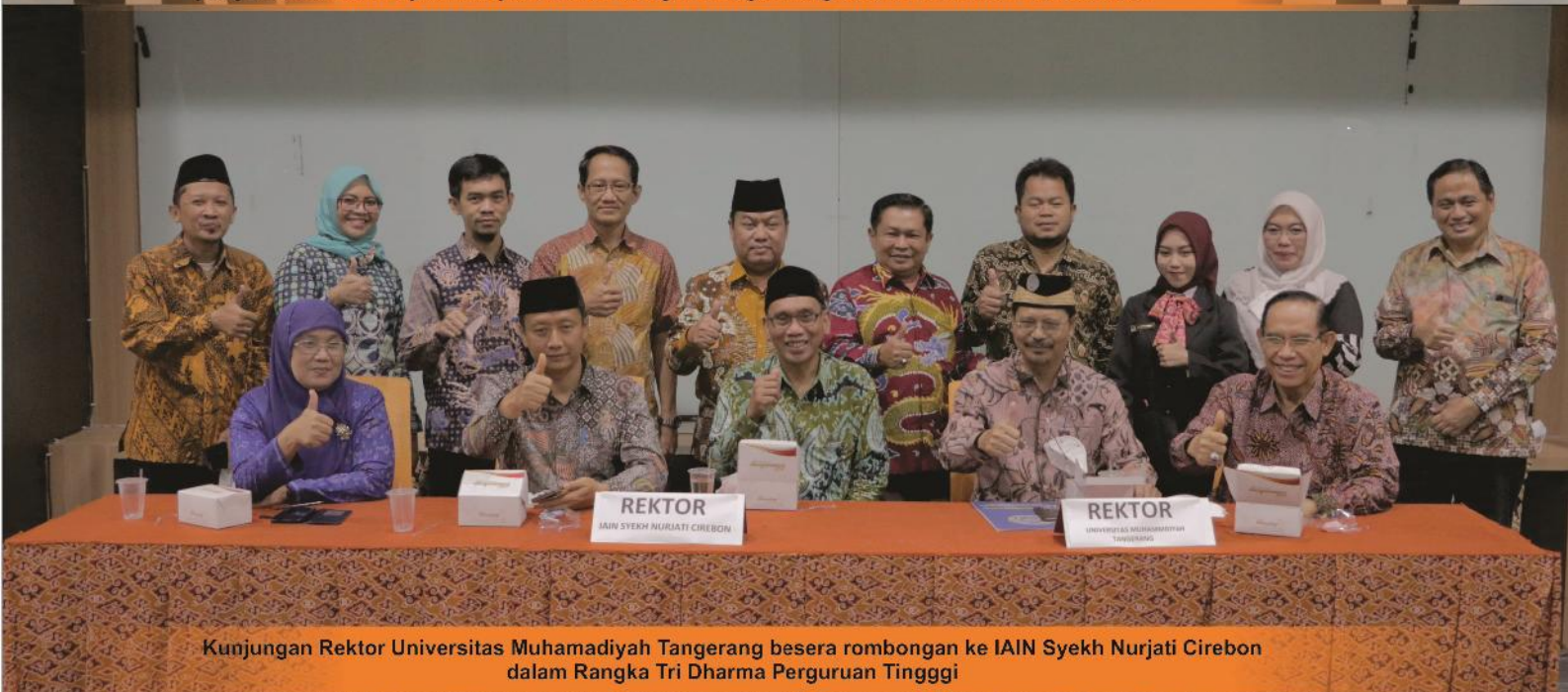
Kunjungan Rektor Universitas Muhammadiyah Tangerang beserta rombongan ke IAIN Syekh Nurjati Cirebon dalam Rangka Tri Dharma Perguruan Tinggi