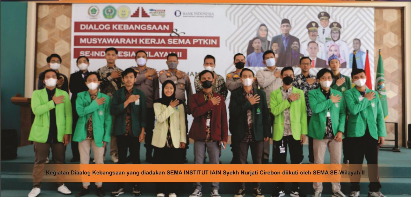
Kegiatan Dialog Kebangsaan yang diadakan SEMA INSTITUT IAIN Syekh Nurjati Cirebon diikuti oleh SEMA SE-Wilayah II