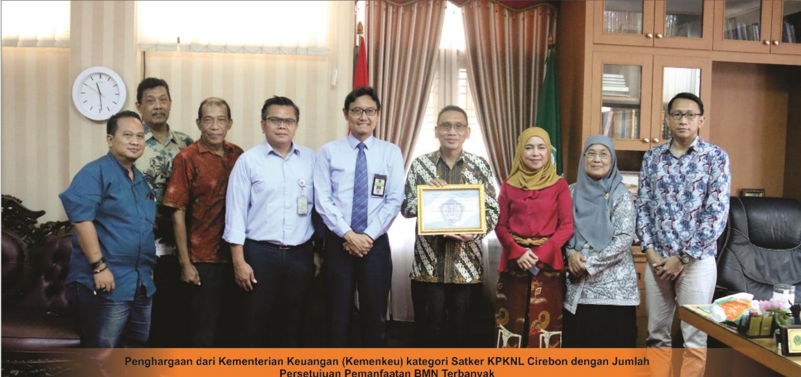
Penghargaan dari Kementerian Keuangan (Kemenkeu) kategori Satker KPKNL Cirebon dengan Jumlah Persetujuan Pemanfaatan BMN Terbanyak