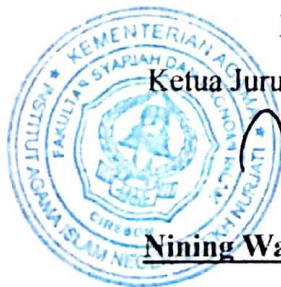
Nining Wahyuningsih, SE.,MM