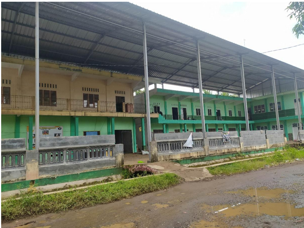
Lokasi MA Al-Amin Puloerang