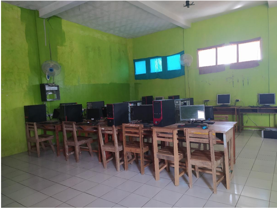
Ruangan Lab. Komputer MA Al-Amin Puloerang