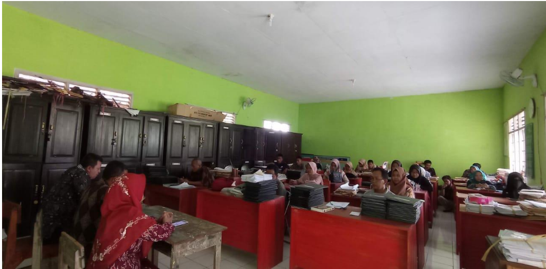
Rapat Gabungan MA & Mts Al-Amin Puloerang